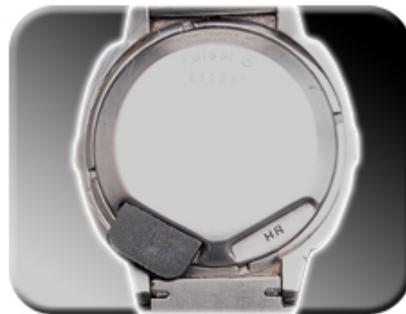
Abb. 9: Minutenverstellung

Die Genauigkeit Zeitzählung kann, wie schon erwähnt, softwareseitig mittels Magneten justiert werden. Hierzu ist beim SASM23 Modul ein zweiter Magnet nötig. Legen Sie jeweils einen der Magneten in jede Kerbe. Dadurch gelangen Sie in den Einstellmodus für die Ganggenauigkeit. Im Display erscheint die Anzeige „cor“ für correction ( Berichtigung ).