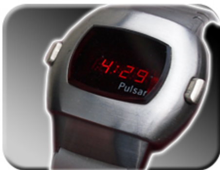
Abb. 2: Zeitanzeige

Wird der rechte Druckknopf Ihrer Uhr bedient, so erscheint die Zeit auf dem Display. Wird der Druckknopf länger betätigt, werden die Sekunden so lange angezeigt, bis die Taste wieder gelöst wird.