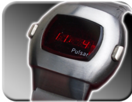
Abb. 4: Datumsanzeige

Wird der linke Druckknopf Ihrer Uhr bedient, so wird die Datumsfunktion aktiviert. Tag und Monat erscheinen auf dem Display in der Form MM:TT.