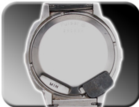
Abb. 6: Magnetverstellung

Die Verstellung von Datum, Zeit und Ganggenauigkeit erfolgt mittels Magnet. Dieser befindet sich in der SchlieÙe Ihrer Uhr. Falls der Originalmagnet nicht mehr zur Hand sein sollte, so kann auch jeder andere Magnet verwendet werden. Wir empfehlen, zunchst Tage, Monate, Stunden und schlieÙlich Minuten einzustellen. Zum Einstellen der Tage platzieren Sie den Magneten in der unten abgebildeten und mit „hr“ markierten Vertiefung.