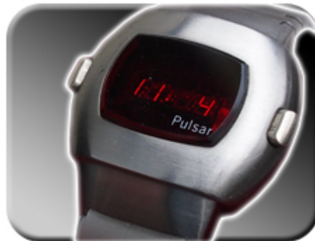
Abb. 7: Datumsverstellung