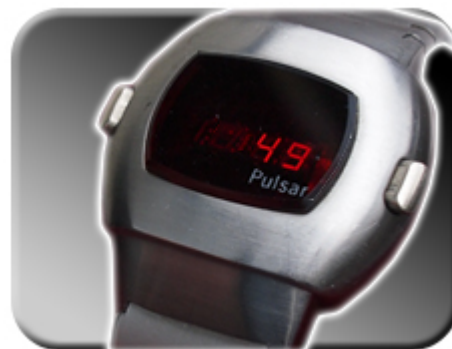
Abb. 3: Anzeige der Sekunden