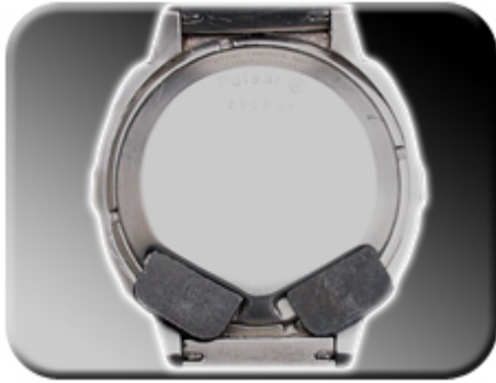
Abb. 10: Menü Ganggenauigkeit