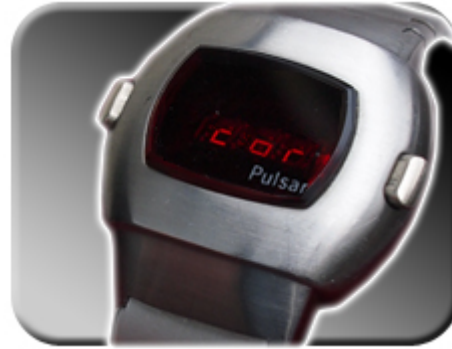
Abb. 11: Das Menü wird gestartet

Im Einstellmodus können Sie zwischen den Korrekturwerten wählen. Läuft die Uhr 1 1/2 Sekunden pro Tag zu schnell, wählen Sie bitte den Korrekturfaktor 1.5- (1.5Minus). Läuft die Uhr eine halbe Sekunde pro Tag zu langsam, wählen Sie die Korrekturfaktor 0.5. Die Faktoren werden zwischen 5.0- und 5.0 weitergeschaltet, indem ein Magnet in die „min“ Kerbe (Abbildung 8) gelegt wird.