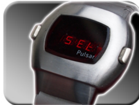
Abb. 13: Bestätigung des Faktors

Wird der passende Faktor angezeigt, drücken Sie die rechte Taste der Uhr, um die Korrektur zu bestätigen. Die Bestätigung der Korrektur wird durch „SET“ auf dem Display angezeigt. Kein Korrekturfaktor (Standard) entspricht dem Wert 0.0. Sollten Sie versehentlich in die Zeitkorrekturfunktion gelangen, so drücken Sie bitte die rechte Taste bei 0.0.