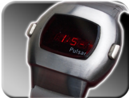
Abb. 12: Korrekturfaktor 1.5-

Im Einstellmodus können Sie zwischen den Korrekturwerten wählen. Läuft die Uhr 1 1/2 Sekunden pro Tag zu schnell, wählen Sie bitte den Korrekturfaktor 1.5- (1.5Minus). Läuft die Uhr eine halbe Sekunde pro Tag zu langsam, wählen Sie die Korrekturfaktor 0.5. Die Faktoren werden zwischen 5.0- und 5.0 weitergeschaltet, indem ein Magnet in die „min“ Kerbe (Abbildung 8) gelegt wird.