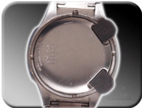
Abb. 10: Menü Ganggenauigkeit

Die Genauigkeit Zeitzählung kann, wie schon erwähnt, softwareseitig mittels Magneten justiert werden. Hierzu ist beim SASM30 Modul ein zweiter Magnet nötig. Legen Sie jeweils einen der Magneten in jede Kerbe. Dadurch gelangen Sie in den Einstellmodus für die Ganggenauigkeit. Im Display erscheint die Anzeige „cor“ für correction ( Berichtigung ).