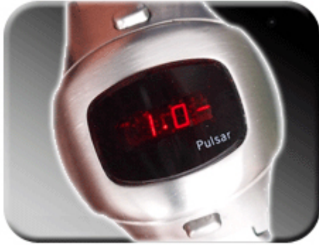
Abb. 12: Korrekturfaktor 1.0-