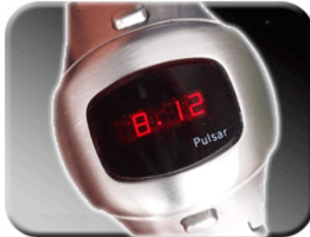
Abb. 4: Datumsanzeige

Wird der obere Druckknopf Ihrer Pulsar bedient, so wird die Datumsfunktion aktiviert. Tag und Monat erscheinen auf dem Display in der Form MM:TT.