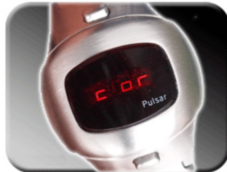
Abb. 11: Das Menü wird gestartet

Im Einstellmodus können Sie zwischen den Korrekturwerten wählen. Läuft die Uhr eine Sekunde pro Tag zu schnell, wählen Sie bitte den Korrekturfaktor 1.0- (1.0Minus). Läuft die Uhr eine halbe Sekunde pro Tag zu langsam, wählen Sie die Korrekturfaktor 0.5. Die Faktoren werden zwischen 5.0- und 5.0 automatisch weitergeschaltet. Einige Versionen haben keine automatische Weiterschaltung. Hierbei muss ein Magnet in die „min“ Kerbe (Abbildung 8) gelegt werden.