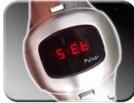
Abb. 13: Bestätigung des Faktors

Wird der passende Faktor angezeigt, drücken Sie den unteren Taster der Uhr, um die Korrektur zu bestätigen. Die Bestätigung der Korrektur wird durch „SEt“ auf dem Display angezeigt. Kein Korrekturfaktor (Standard) entspricht dem Wert 0.0. Sollten Sie versehentlich in die Zeitkorrekturfunktion gelangen, so drücken Sie bitte die untere Einstelltaste bei 0.0.