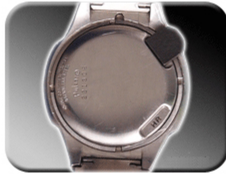
Abb. 9: Minutenverstellung

Die Genauigkeit Zeitzählung kann, wie schon erwähnt, softwareseitig mittels Magneten justiert werden. Hierzu ist beim SASM30 Modul ein zweiter Magnet nötig. Legen Sie jeweils einen der Magneten in jede Kerbe. Dadurch gelangen Sie in den Einstellmodus für die Ganggenauigkeit. Im Display erscheint die Anzeige „cor“ für correction ( Berichtigung ).