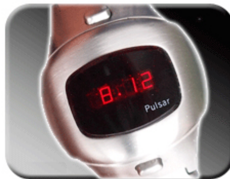
Abb. 7: Datumsverstellung

Gleichzeitig mussen beide Taster gehalten werden. Zustzlich zur Verstellung des Tages wird die AM / PM Funktion eingestellt. Der obere Punkt sollte zwischen 00:00h und 11:59h leuchten, zwischen 12:00h und 23:59h der untere Punkt. Wird die obere Drucktaste losgelassen werden die Monate inkrementiert. Am 29.02. eines jeden Jahres (Ausnahme sind Schaltjahre) muss das Datum manuell auf den 01.03. versetzt werden.