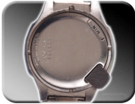
Abb. 8: Stundenverstellung