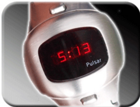
Abb. 2: Zeitanzeige

Wird der untere Druckknopf Ihrer Pulsar bedient, so erscheint die Zeit auf dem Display. Wird der Druckknopf länger betätigt, werden die Sekunden so lange angezeigt, bis die Taste wieder gelöst wird.