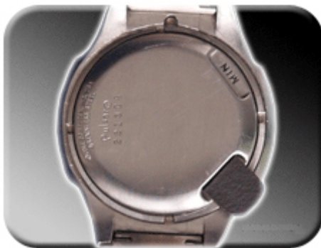
Abb. 6: Magnetverstellung

Die Verstellung von Datum, Zeit und Ganggenauigkeit erfolgt mittels Magnet. Dieser befindet sich in der SchlieÙe Ihrer Uhr. Falls der Originalmagnet nicht mehr zur Hand sein sollte, so kann auch jeder andere Magnet verwendet werden. Wir empfehlen, zunchst Tage, Monate, Stunden und schließlich Minuten einzustellen. Zum Einstellen der Tage platzieren Sie den Magneten in der unten abgebildeten und mit „hr“ markierten Vertiefung.