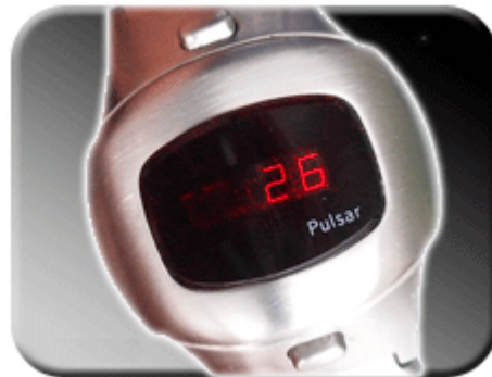
Abb. 3: Anzeige der Sekunden