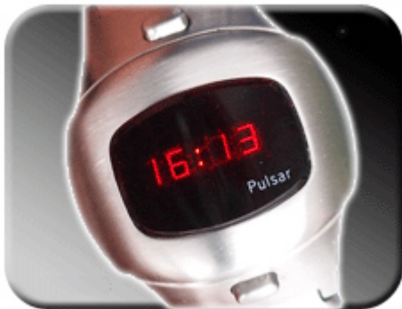
Abb. 2: Zeitanzeige

Wird der untere Druckknopf Ihrer Pulsar bedient, so erscheint die Zeit auf dem Display. Wird der Druckknopf länger betätigt, werden die Sekunden so lange angezeigt, bis die Taste wieder gelöst wird.