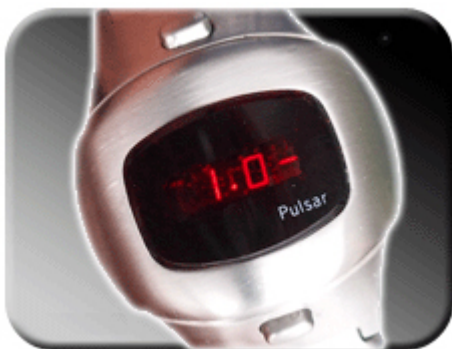
Abb. 4: Korrekturfaktor 1.0-

Im Einstellmodus können Sie zwischen den Korrekturwerten wählen. Läuft die Uhr eine Sekunde pro Tag zu schnell, wählen Sie bitte den Korrekturfaktor 1.0- (1.0 Minus). Läuft die Uhr eine halbe Sekunde pro Tag zu langsam, wählen Sie die Korrekturfaktor 0.5. Die Faktoren werden zwischen 5.0- und 5.0 automatisch weitergeschaltet.