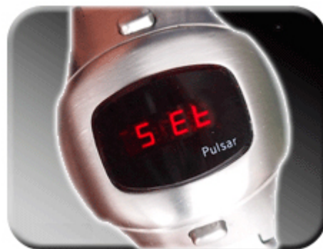
Abb. 5: Bestätigung des Faktors