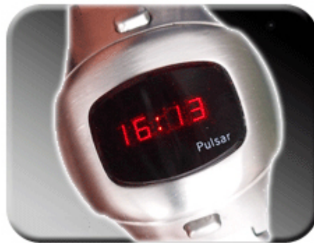
Abb. 7: Zeitverstellung

Zusätzlich zur Verstellung des Tages wird die AM / PM Funktion eingestellt. Der obere Punkt sollte zwischen 00:00h und 11:59h leuchten, zwischen 12:00h und 23:59h der untere Punkt.