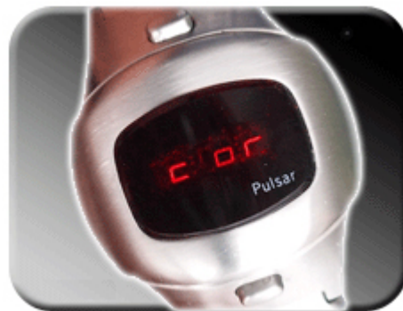
Abb. 5: Einstellmodus Frequenz

Im Einstellmodus können Sie zwischen den Korrekturwerten wählen. Läuft die Uhr eine Sekunde pro Tag zu schnell, wählen Sie bitte den Korrekturfaktor 1.0- (1.0 Minus). Läuft die Uhr eine halbe Sekunde pro Tag zu langsam, wählen Sie die Korrekturfaktor 0.5. Die Faktoren werden zwischen 5.0- und 5.0 automatisch weitergeschaltet.