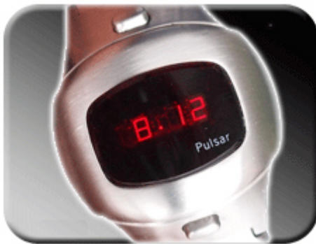
Abb. 6: Datumsverstellung

Die Verstellung von Datum und Zeit erfolgt mittels Taster. Wir empfehlen zunächst Monate, Tage, Stunden und schließlich Minuten einzustellen. Zum Einstellen der Monate drücken Sie den oberen Taster 4x. Nun können Sie durch das Halten des oberen Tasters den aktuellen Monat einstellen. Ein Jahr hat 366 Tage. Somit muss am 29.02 eines jeden Jahres (Ausnahme sind Schaltjahre) das Datum auf den 01.03 gesetzt werden. Mit dem unteren Taster kann der Tag erhöht werden.