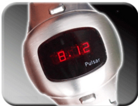
Abb. 4: Datumsanzeige

Wird der obere Druckknopf Ihrer Pulsar bedient, so wird die Datumsfunktion aktiviert. Tag und Monat erscheinen auf dem Display in der Form MM:TT. Wird die obere Taste länger als vier Sekunden gehalten, so gelangen Sie in den Einstellmodus für die Ganggenauigkeit. Im Display erscheint die Anzeige „cor“ für correction ( Berichtigung ).