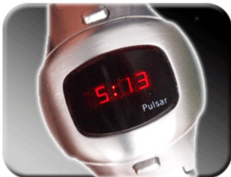
Abb. 2: Zeitanzeige

Wird der untere Druckknopf Ihrer Pulsar bedient, so erscheint die Zeit auf dem Display. Wird der Druckknopf länger betätigt, werden die Sekunden so lange angezeigt, bis die Taste wieder gelöst wird.