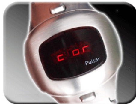
Abb. 11: Das Menü wird gestartet

Im Einstellmodus können Sie zwischen den Korrekturwerten wählen. Läuft die Uhr eine Sekunde pro Tag zu schnell, wählen Sie bitte den Korrekturfaktor 1.0- (1.0Minus). Läuft die Uhr eine halbe Sekunde pro Tag zu langsam, wählen Sie die Korrekturfaktor 0.5. Die Faktoren werden zwischen 5.0- und 5.0 automatisch weitergeschaltet. Einige Versionen haben keine automatische Weiterschaltung. Hierbei muss ein Magnet in die „min“ Kerbe (Abbildung 8) gelegt werden.