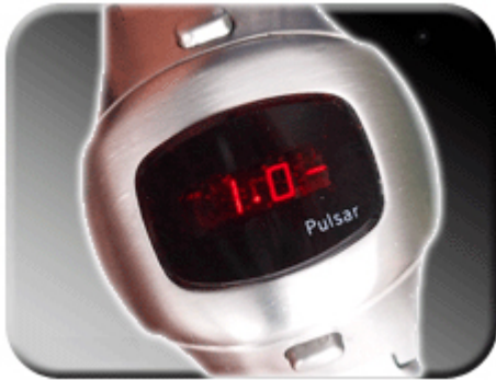
Abb. 12: Korrekturfaktor 1.0-