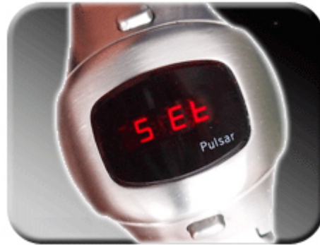
Abb. 13: Bestätigung des Faktors

Wird der passende Faktor angezeigt, drücken Sie den unteren Taster der Uhr, um die Korrektur zu bestätigen. Die Bestätigung der Korrektur wird durch „SEt“ auf dem Display angezeigt. Kein Korrekturfaktor (Standard) entspricht dem Wert 0.0. Sollten Sie versehentlich in die Zeitkorrekturfunktion gelangen, so drücken Sie bitte die untere Einstelltaste bei 0.0.