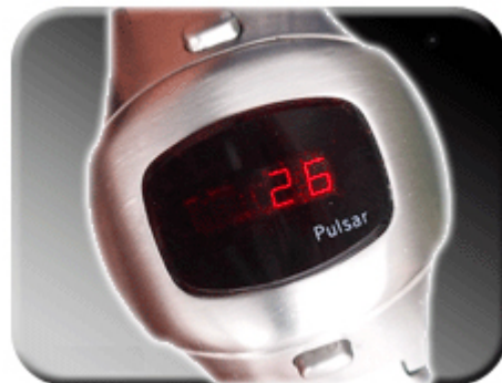
Abb. 3: Anzeige der Sekunden